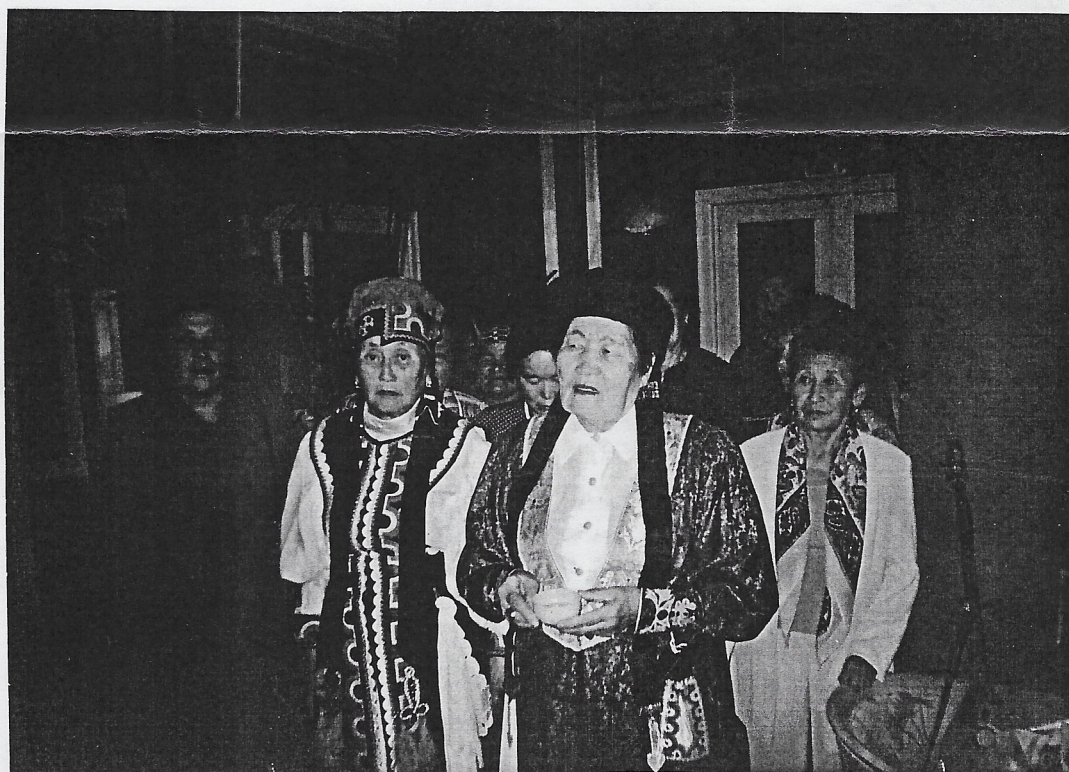
Août 2002 - 18 "Edge" - grands-mères kalmoukes - ont bénéficié d'un séjour d'une semaine à Paris offert par le Président de la République de Kalmoukie, Monsieur Kirsan Ilioumjinov

L'homme qui ne connaît pas son lignage, c'est l'animal qui ne connaît pas l'eau.