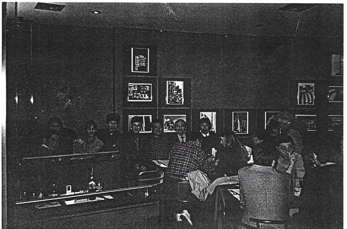
Novembre 2000 - Paris - Soirée de "Zoul".