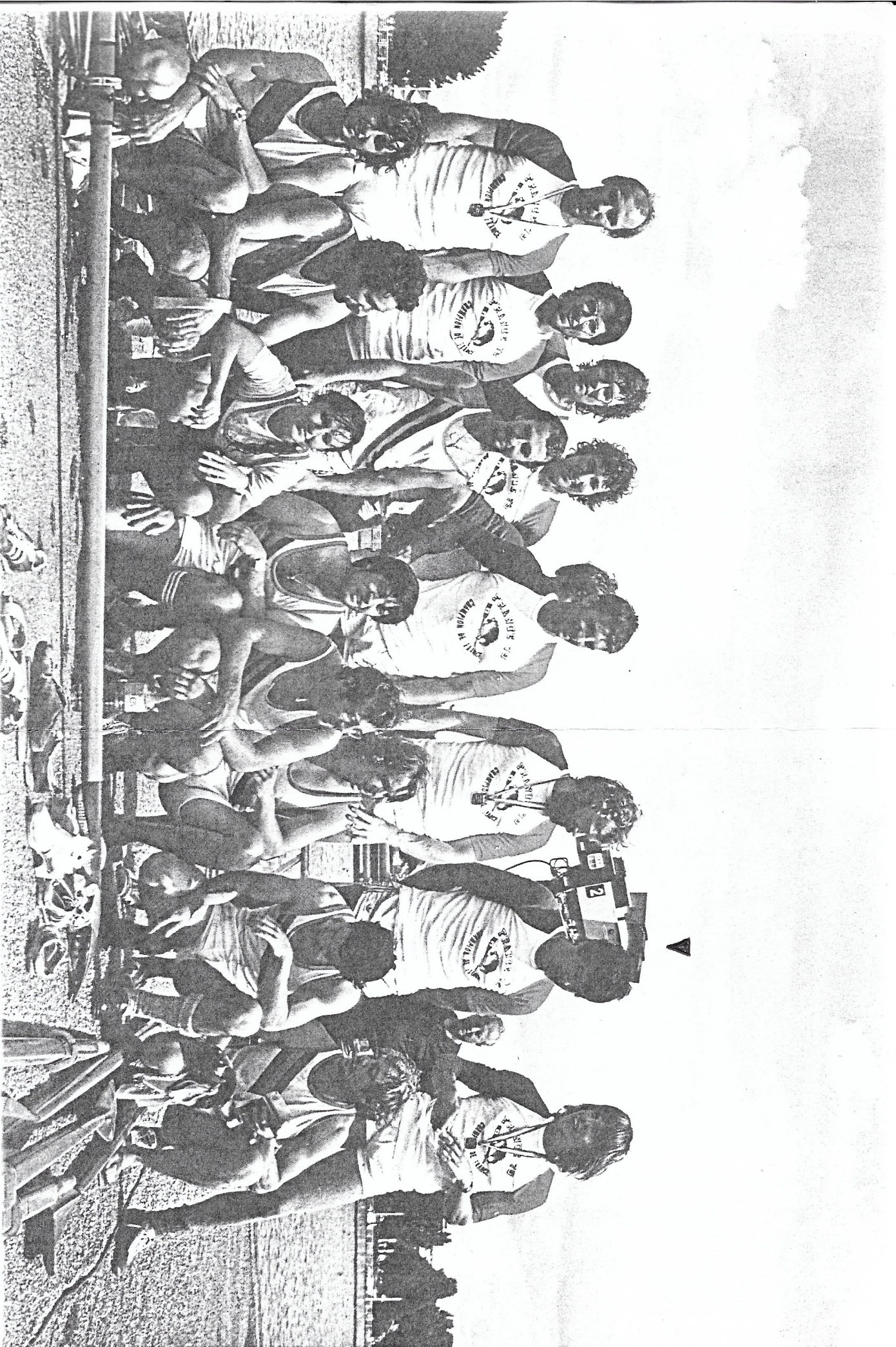
Les deux "Huit Senior" de l'Aviron de Joinville réunis après leur 1 re et 5 e place en finale des Championnats de France 1979. Pour la première fois un Club a réussi à placer deux bateaux dans l'épreuve reine des Championnats de France à l'Aviron.