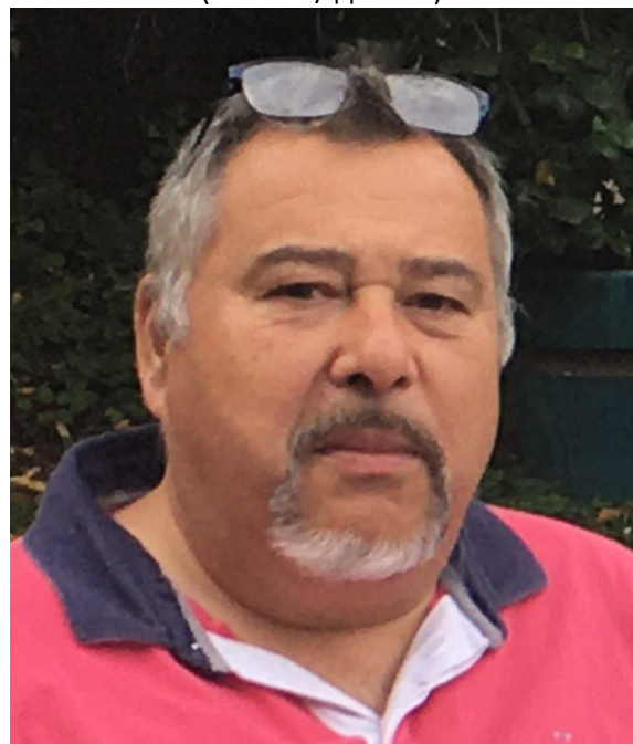
(Pascal / Паскаль)