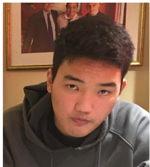
(Danzan / данзан)

В сентябре : Кармен 2/09; Натали 9/09; и Стефан 23/09!!!