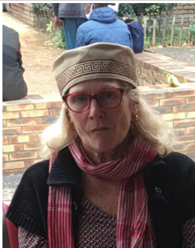
(Carmen / Кармен)