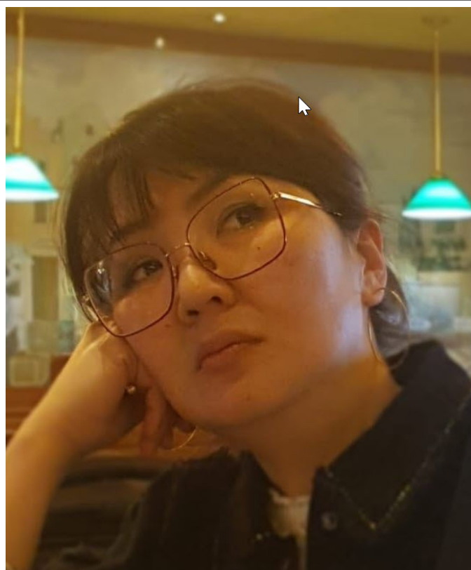
(Vairta / Байрта)